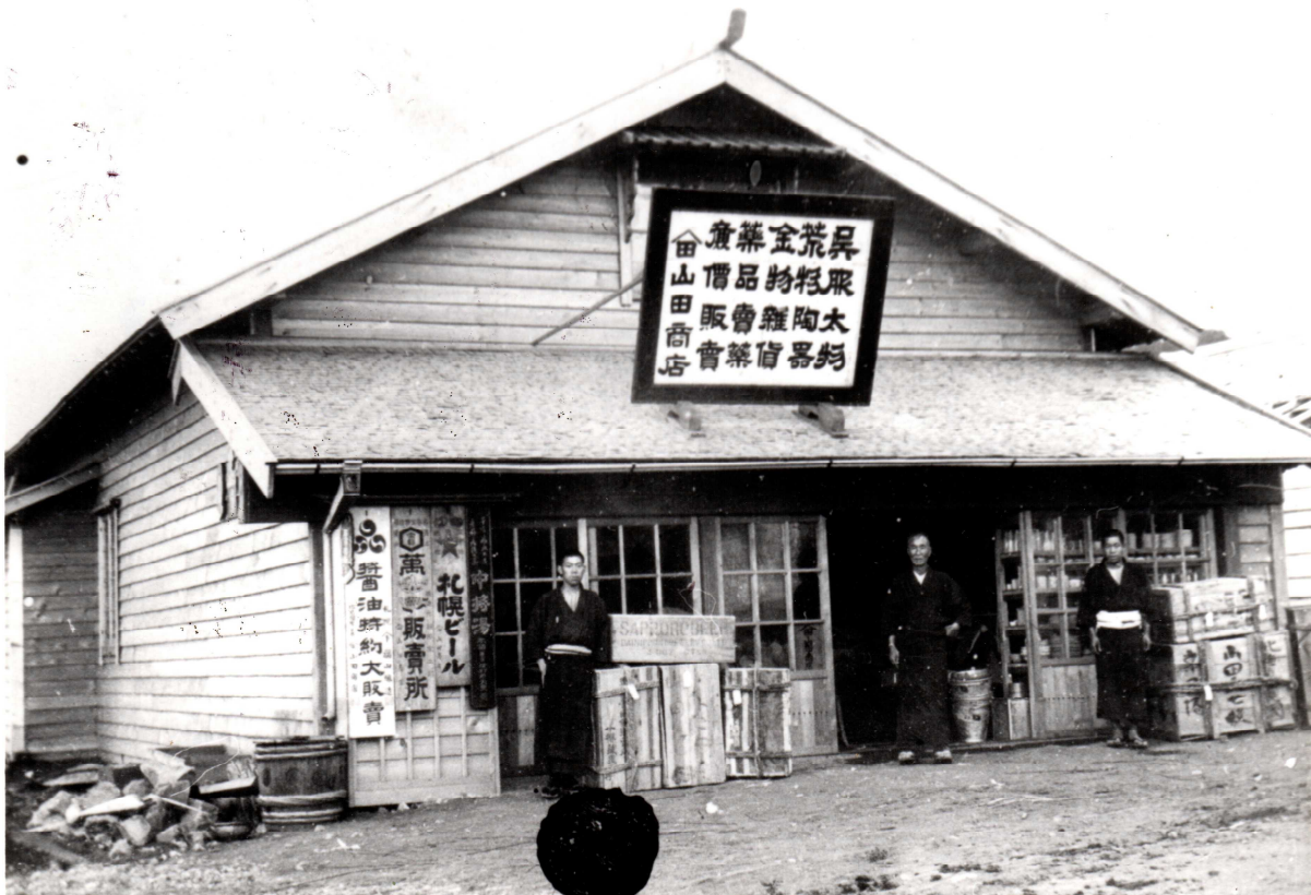
明治42年撮影の山田本店(山田商店))