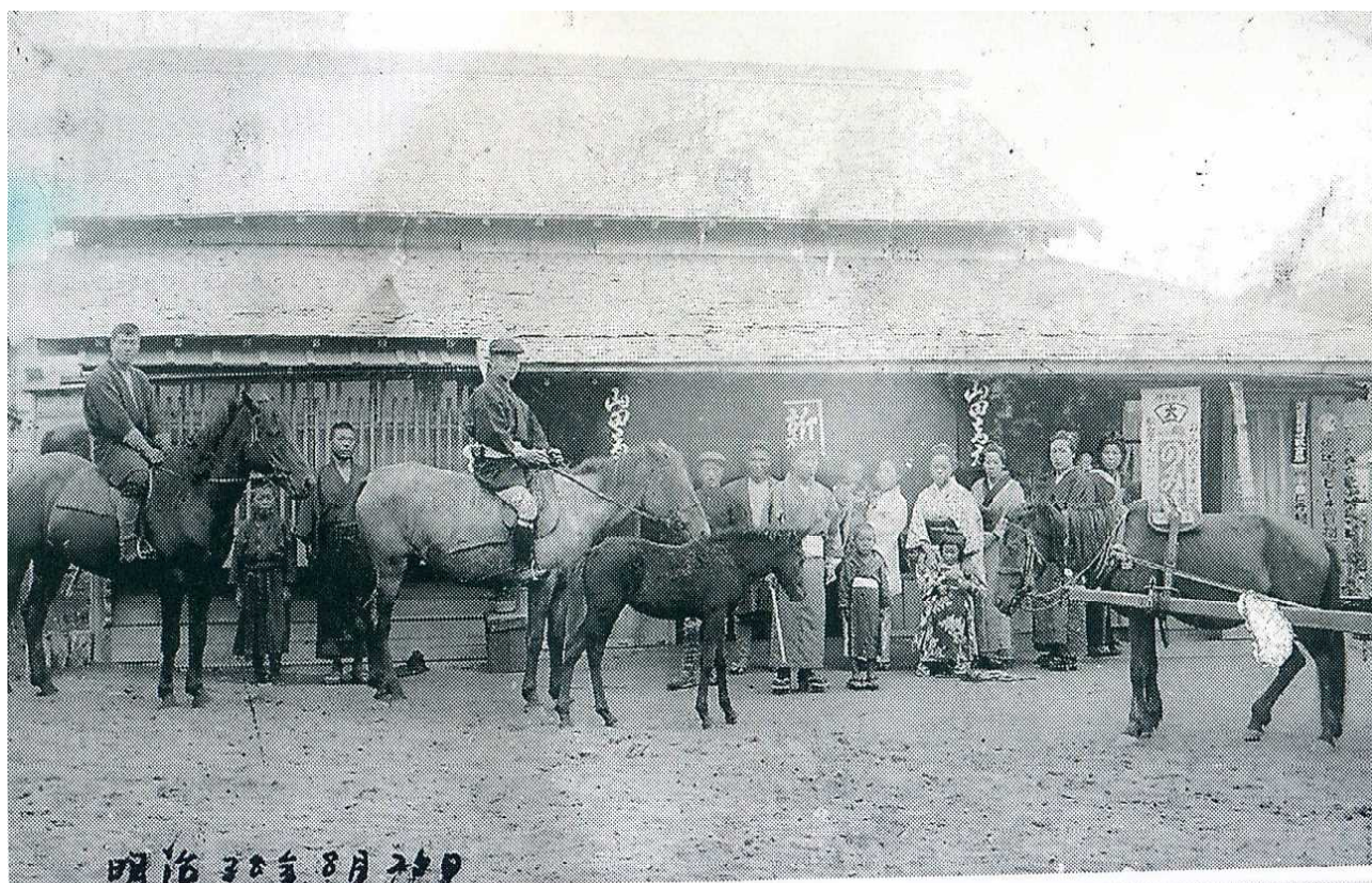
明治38年8月撮影の山田本店